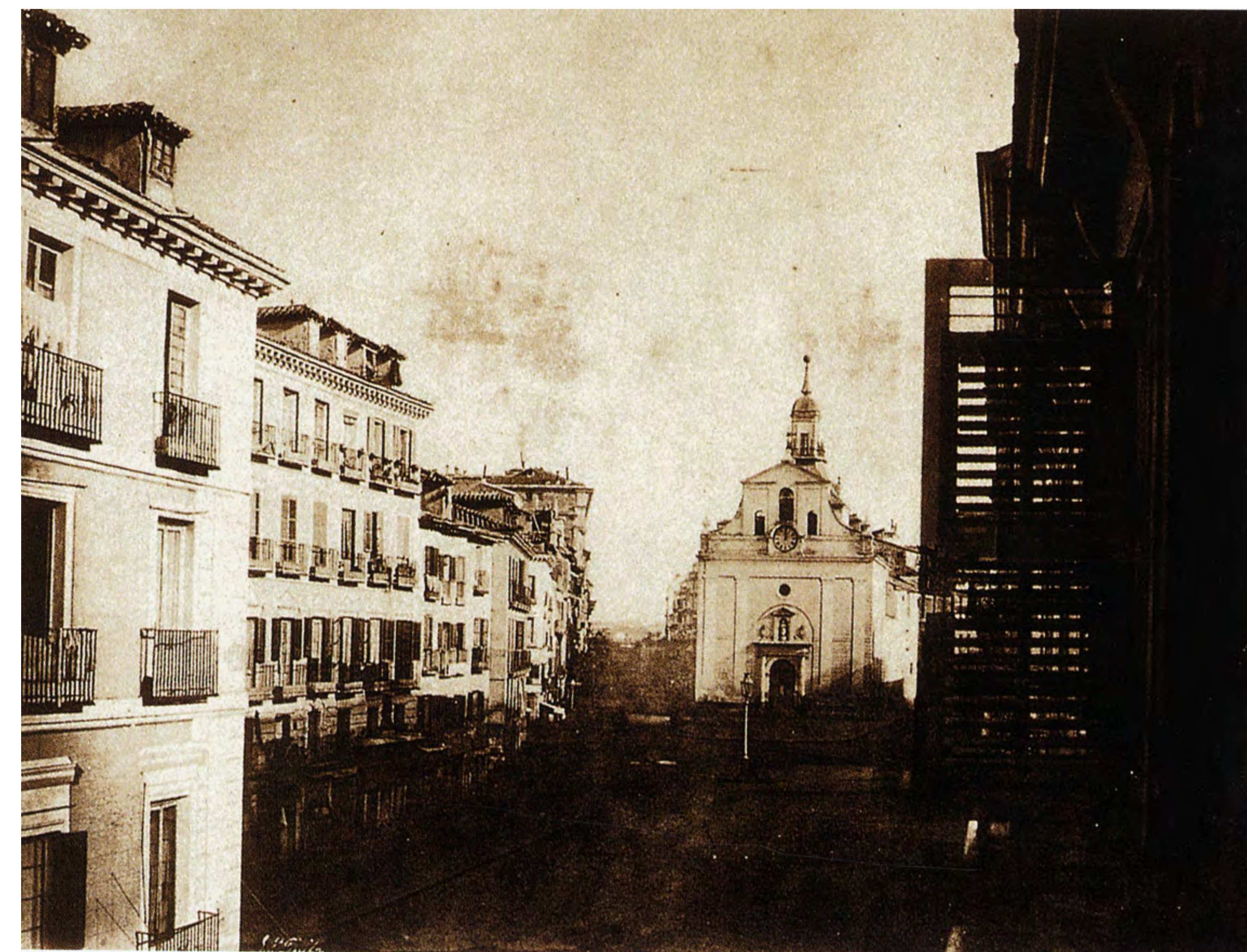
Puerta del sol antes de su remodelación . Iglesia del Buen Suceso al fondo.

El edificio de La Fonda París se construyó en la parte oriental de la puerta del sol, después de que la desamortización de Mendizabal dejase disponible el solar que ocupó la iglesia del buen suceso.